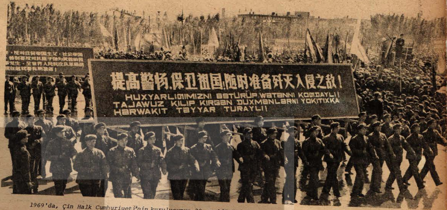
1969'da, Çin Halk Cumhuriyeti'nin kuruluşunun 20. yıldönümünde, Urumçi'de düzenlenen kutlama şenlikleri sırasında, hem Çince, hem Uygurca yazılı pankartlarla geçen Çin Halk Kurtuluş Ordusu savaşıları. Pankartta "Hazırlığımızı tamamlayıp vatani koruyalım! Saldırıya yeltenecek bütün düşmanları yok etmeye her vakit hazır bulunalım!" ibaresi yer almaktadır.

Milliyetler arasındaki birlik ve dayanışmayı sağlayabilmek için Çin