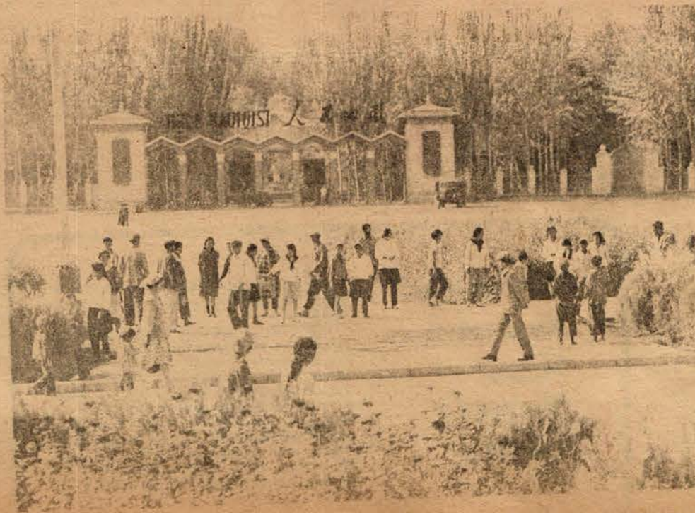
Çin'in Sinkiang Özerk Bölgesinde, Kaşgar şehrinde Halk Bahçesi. Parkın girişinde, "Halk Bahçesi"nin hem Uygurca, hem Çince yazılmış olduğu görülüyor.

Yurttaşlar söz, haberleşme basın, toplanma, dernek kurma, gösteri ve yürüyüş yapma hürriyetlerine; grev yapma hürriyetine; dinî inanç hürriyetine; dini inançsızlık hürriyetine; ve tanrı tanımazlığın propagandasını yapma hürriyetine sahiptirler.